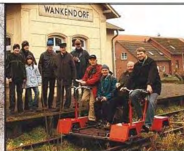
Strecke frei bis Wankendorf: Im Januar 2007 konnten die Draisinenfreunde erstmals bis nach Wankendorf fahren.

meinde gemacht, und das hierfür erforderliche Geld würde an anderer Stelle dringender gebraucht. Der Vorwurf der Draisinenfreunde an die Bahn bleibt hingegen. So habe die Bahn noch während der